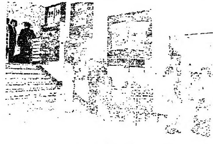
حوار على المشي